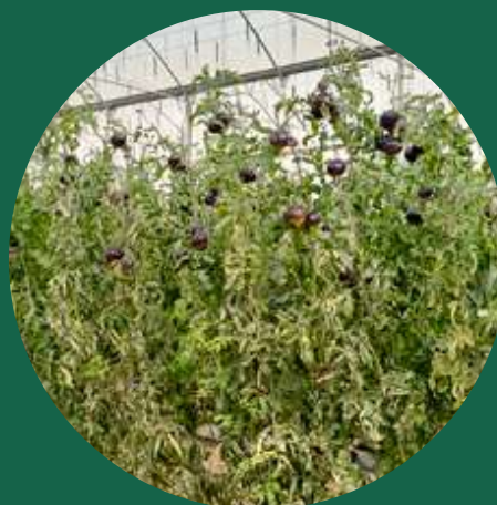
Εφαρμογή με SETTER