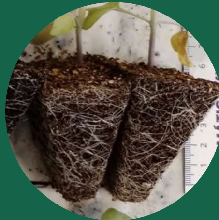
Επεξεργασία με RIZZA